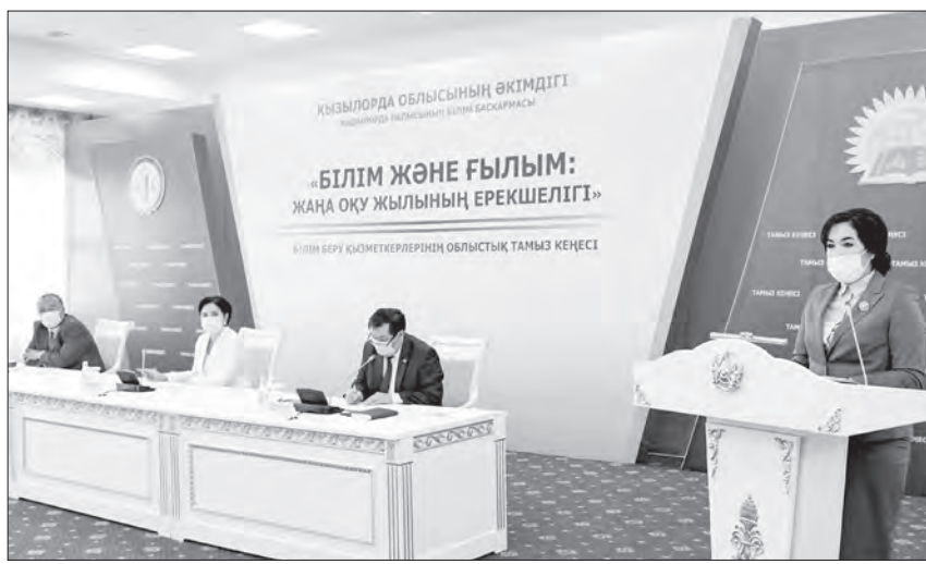
салаға, оның ішінде мектептерді жөндеуге жұмсалып жатқаны қуантты. Қаншама жөндеу көрмеген білім ұялары жөнделіп, жаңарып қалыпты.

Биыл мектептерді заманауи талаптарға сәйкестендіруге мүмкіндік алған ерекше кезең болды. Бірнеше жылдан бері жөндеуді қажет еткен білім беру нысандары жаңарып, құрылыс қарқын алды. Осы жылы 55 білім беру ордасына жөндеу жұмыстары жүргізілуде. Облыста Қызылорда қаласынан және Жалағаш ауданынан 2 мектеп пайдалануға беріледі. Сонымен қатар, 4 мектептің құрылысы жүргізілуде. Оның ішінде Қызылорда қаласынан 600 орындық, Арал ауданы, Сексеуіл кентіндегі 300 орындық мектептер құрылысы жыл соңында аяқталады. Жаңа мектеп салуда мемлекеттік-жекеменшік әріптестік бастамалардың үлесі де артып келеді. Биыл облыс орталығында 500 және 300 орындық 2 жеке мектептің құрылысы жүргізілуде.