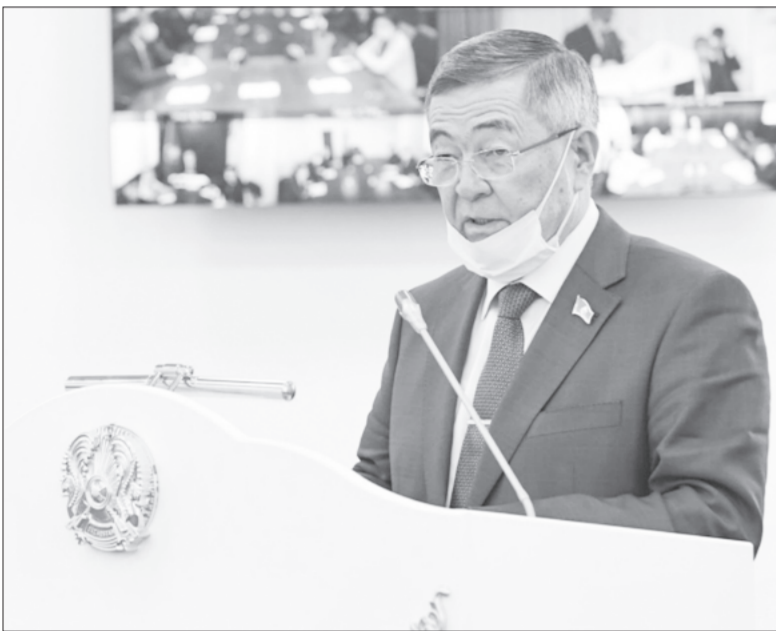
Мемлекет басшысы Қасым-Жомарт Кемелұлы Тоқаев Парламент палаталарының бірлескен отырысында Қазақстан халқына арналған «Жаңа жағдайдағы Қазақстан: Іс-қимыл кезеңі» атты Жолдауын жариялады.

Биылғы Жолдау – стратегиялық маңыздылығымен қазіргі сындарлы кезеңде нақты міндеттер мен өзекті мәселелерді шешуін қамтамасыз етуге бағытталған. Сондай-ақ еліміздің басына түскен пандемия кезеңінде орын алған қиыншылықтарға қарамастан, Қазақстанның одан әрі дамуын қамтамасыз ете отырып, кезек күттірмейтін мәселелерді айқындап берді.