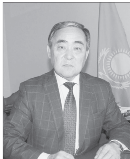
қарай құқық қорғау және сот жүйелеріне реформа қажеттігіне баса назар аударды.

Мемлекет басшысы «Халық үніне құлақ асатын мемлекет» – бұл, шын мәнісінде, «Әділетті мемлекет» құру тұжырымдамасы. Азаматтардың мәселелерін тыңдап, көріп қана қою жеткіліксіз. Ең бастысы – дұрыс және әділ шешім шығару қажет», – дей келе, еліміздің қазіргі жағдайдағы талабына