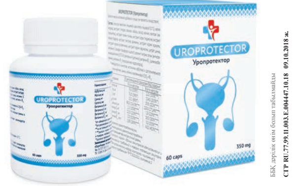
Негізгі әсер етуші заттар: препарат құрамына химиялық құраушылар кірмейді. Мәшһері және қолдану тәсілі: қабылдау уақытымен 1 айдан бастап. Қарсы көрсеткіштер: жеке құрылымдары сәйкес келмейді.

НАЗАР АУДАРЫҢЫЗ! НАУҚАН ЖҮРУДЕ! «УРОПРОТЕКТОР» ҚУРСТЫҚ БАҒДАРЛАМАСЫНА ТАПСЫРЫС БЕРСЕНІЗ, -30% ЖЕҢІЛДІК!