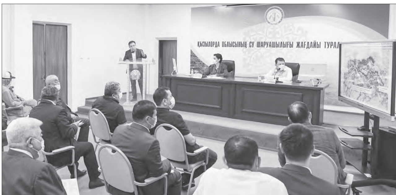
мәселелер назарға алынып, алдағы уақытта шешілу жолдары қарастырылатынын жеткізді.