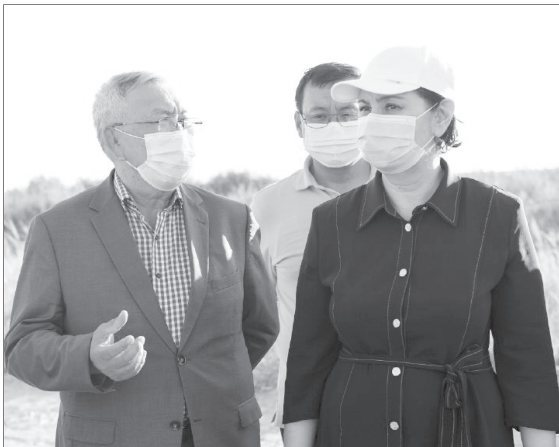
шабындық жерлерін суландыруға мүмкіндік туады.

Сонымен қатар облыс әкімі «Бұрмақұлақ» учаскесіндегі «Аспай» суағатықсының жағдайымен танысты. Қазіргі таңда «Ақшатау-Қамыстыбас» көлдер жүйесін суландыру үшін суағатықны қайта іске қосып, Бұрмақұлақ арнасын бөгеу қажет. Жауапты мамандардан құрылған жұмысшы топтың зерделеу қорытындысымен нысанның ақау әктісі жасалды. Жоба жүзеге асқан жағдайда «Ақшатау-Қамыстыбас» көлдер жүйесін толтыру және Аманөткел, Райым, Жетес би, Қамыстыбас, Жаңақұрылыс ауылдық округтеріндегі жайылымдық