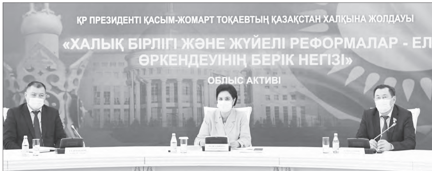
ҚР ПРЕЗИДЕНТІ ҚАСЫМ-ЖОМАРТ ТОҚАЕВТЫҢ ҚАЗАҚСТАН ХАЛҚЫНА ЖОЛДАУЫ

«ХАЛЫҚ БІРЛІГІ ЖӘНЕ ЖҮЙЕЛІ РЕФОРМАЛАР - ЕЛ ӨРКЕНДЕУІНІҢ БЕРІК НЕГІЗІ»