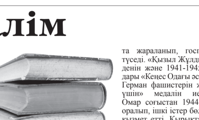
Мәлімта Ұрғашқы, М.Толыбеков атындағы №3 ІП мектеп-лицейінің мұғалімі

Республикасының Конституциясының 1-бабында мемлекеттің зайырлық сипаты нақты жазылған. Осы бағыттағы жұмыстарға қоғамның барлық саласы толыққанды қатысып келеді.