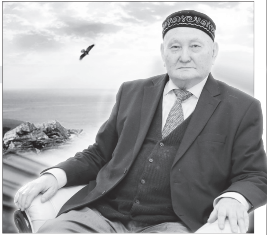
Қашанда қалауы артық, талабы ашық, Тез кеттім шулы ортаға араласым. Ой құдым, білім құдым, жыр да жаздым,

Алдымнан аласартпай талап тауды, Жылдарым өсіп, толып, жаратқанды. Сонымен жетіс екінің соңы бітіп, Үшінші он жылым да аяқталды.