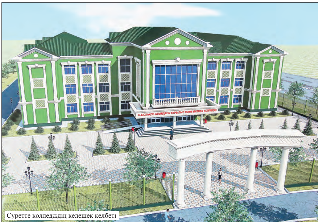
Суретте колледждің келешек келбеті