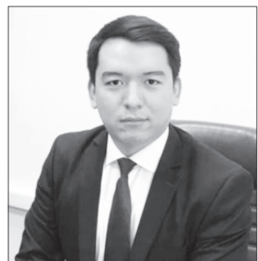
сарапшы болып жұмыс жасаған.

Еңбек жолын 2010 жылы «ТМФ Казахстан» ЖШС есепшінің көмекшісі болып бастап, әрі қарай экономика саласында қызмет атқарып, бірқатар мемлекеттік органдарда тапшырап,