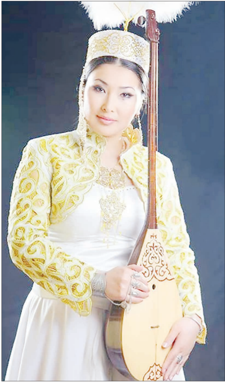
Негізгі жырару бүкіл халық атынан сөйлейді. «Жырау» деген сөз, «жыр» – эпос, аңыз, өлең деген сөзден шыққан. Жыраулар эпостық шығармалар шығарған және оны орындаған. Кейінірек, XVII ғасырда жыраулар орнына жыршылар келді, олар эпостық шығармалардың орындаушылары еді.

2006 жылы облыстық халық шығармашылығы және продюсерлік орталығында жұмыс жасалды. Облыс әкімі ансамблінің мүшесі болды. 2010 жылдан Елордадағы С.Сейфуллин мұражайында директордың орынбасары қызметін атқарды. Қазіргі таңда «Наз» мемлекеттік би театрының әнішісі. Мақамның мінезін, сипатын, құрылымын түсінетін, кәсіби сауатты өнер несімен сыр сұхбат құрған едік.