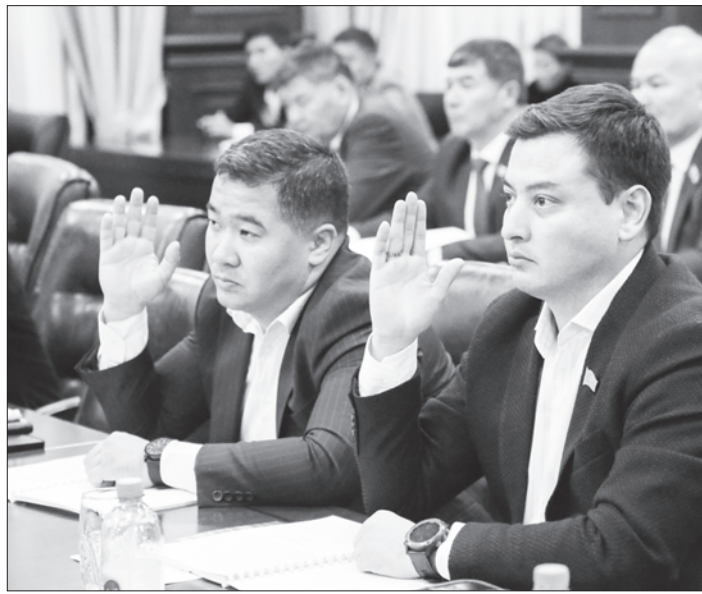
шешім қабылданды. Бұл – өңір үшін үлкен мүмкіндік.

– Өңірге келгелі бюджеттің мүмкіндігіне иек артып ғана қоймай, елге жанашыр демеушілерді тарта отырып, әлеуметтік нысандар салуды қарқынды түрде бастап кеттік. Қазіргі таңда бюджетке көптеген қосымша қаражат тартуға жұмыс жасалуда. Бұған дейін Қызылорда қаласынан көпсалалы аурухана және емхана салуға республикалық бюджеттен 36,4 млрд теңгеге ұсыныс берген болатынбыз. Сәті туып, қаржы алуға қолдау таптық. Құрылыс жұмыстарын келесі жылы бастауға 750 млн теңге бөлуге