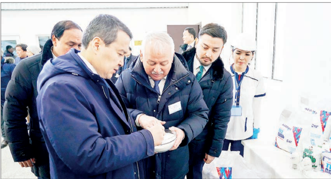
Кеше Қазақстан Республикасының Премьер-Министрі Әлихан Смайылов жұмыс сапарымен Қызылорда облысына келді. Үкімет басшысы өңірдің әлеуметтік-экономикалық даму барысымен танысып, өзекті мәселелерді шешу барысын талқылады және негізгі инфрақұрылымдық, өнеркәсіптік, әлеуметтік нысандарды аралады.