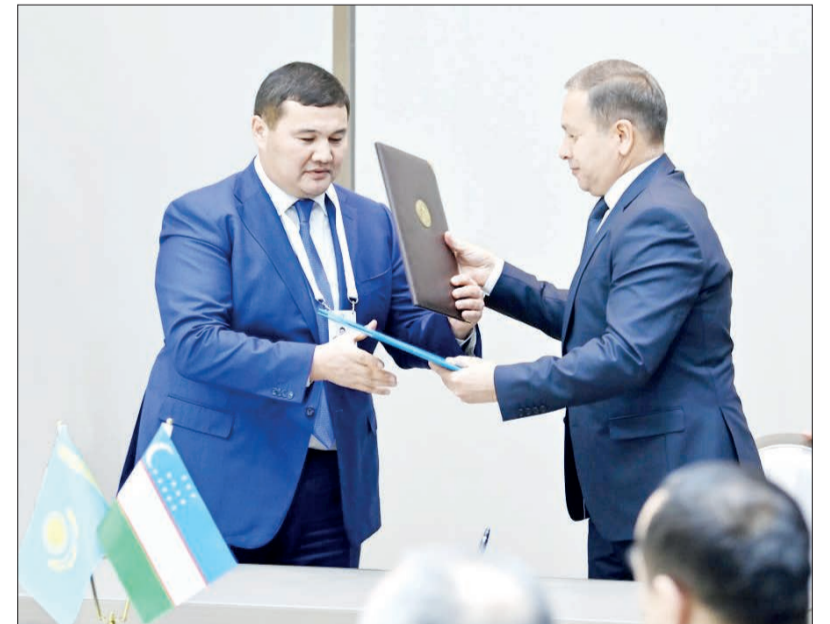
Мемлекет басшысы Қасым-Жомарт Кемелұлы Тоқаевтың Өзбекстанға мемлекеттік сапарының ресми делегациясының құрамында облыс әкімі Нұрлыбек Нәлібаев болды.

Екі күндік сапардың алғашқы күнінде аймақ басшысы Нұрлыбек Нәлібаев бастаған облыстық делегация Қазақстан-Өзбекстан өңіраралық бизнес форумына қатысты.