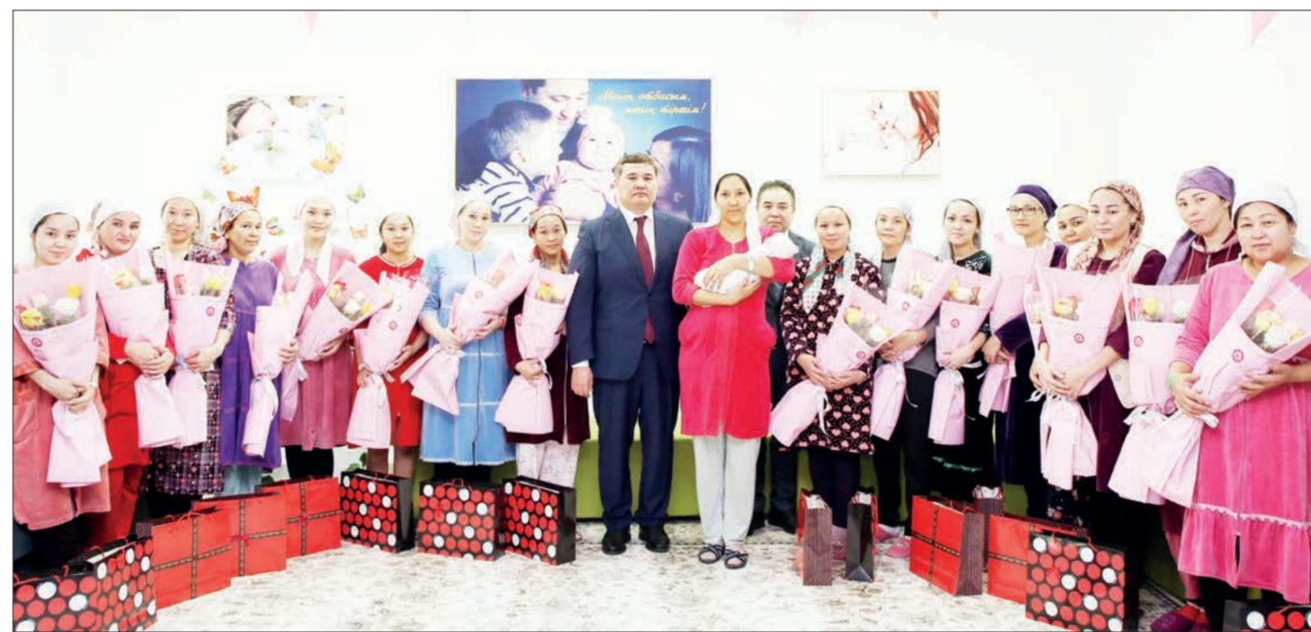
8 наурыз – Халықаралық әйелдер күні қарсаңында облыс әкімі Нұрлыбек Нәлібаев «Ана мен бала орталығы» және «Persona Medical» клиникасының қызметімен танысып, осы ұжымдарда қызмет ететін қыз-келіншектерді мерекелем құттықтады.

— Елімізде Президент тапсырмасымен ана мен баланың денсаулығын жақсарту үшін бірқатар жұмыстар атқарылуда. Кәсіпкер демеушілігімен облыс орталығында «Анаға тағзым» орталығының құрылысы салынуда. Көпбалалы отбасыларға көрсетілетін көмек мөлшері де жыл өткен сайын ұлғайып келеді.