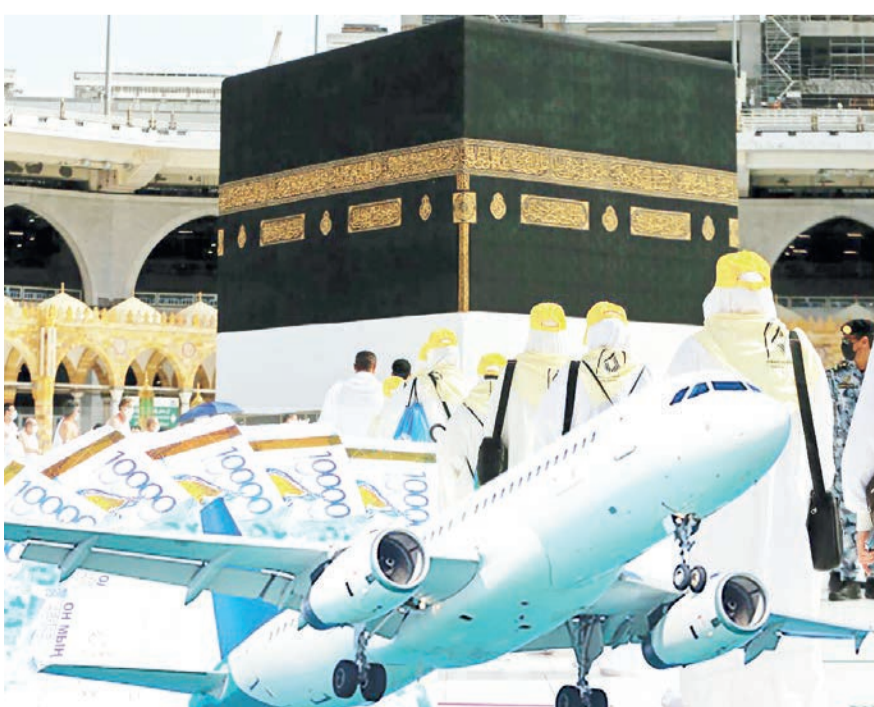
Ашық ақпарат қолжетпейді

«Қажыға барған қазақтар» атты кітаптың мұқабасынан «Барлық жол Меккеге апарды» деген халық мәтелін оқып қалдым.