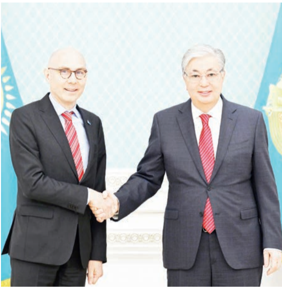
Мемлекет басшысы Қасым-Жомарт Тоқаев БҰҰ-ның Адам құқықтары жөніндегі жоғарғы комиссары Фолькер Тюркпен кездесті.

Қасым-Жомарт Тоқаев Фолькер Тюркке ілтат білдіре отырып, оның бұл сапары Қазақстан мен БҰҰ-ның Адам құқықтары жөніндегі жоғарғы комиссарының басқармасы арасындағы ынтымақтастықты одан әрі нығайту үшін маңызды екенін атап өтті. Мемлекет басшысы еліміздің адам құқықтарын қорғау мәселесі бойынша тығыз қарым-қатынас орнатуға және ақпарат алмасуға дайын екенін мәлімдеді.