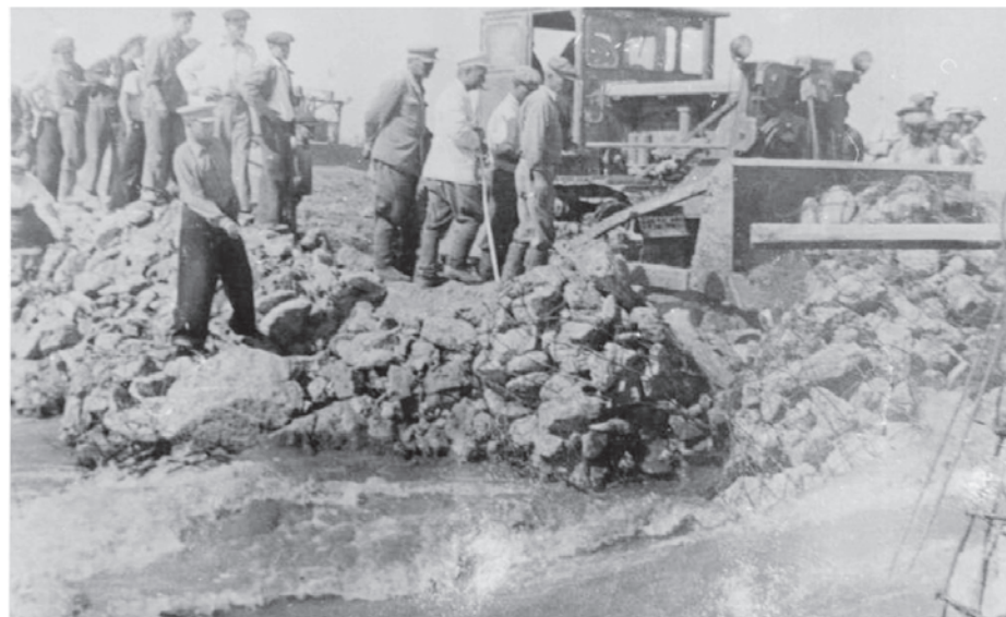
Қызылорда плотина құрылысы, 1940 ж.

бірқатары Қызылорда облысына жөнелтілді. Жосалы станциясына бірнеше өндіріс орны – Харьков эмаль зауыты, Харьков майлау зауыты, электр лампаларын регенерация-