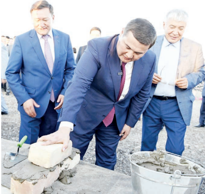
Кеше Қызылорда қаласының сол жағалауында маңызды екі нысанның құрылысы басталды. Күн сайын көркейіп келе жатқан шаһарда жаңадан физика-математика бағытындағы мектеп-интернат пен автовокзал бой көтермек. Бірі келешек ұрпақтың біліміне бастау болса, екіншісі жолы түскенің жайлылығына кепіл болатыны даусыз.