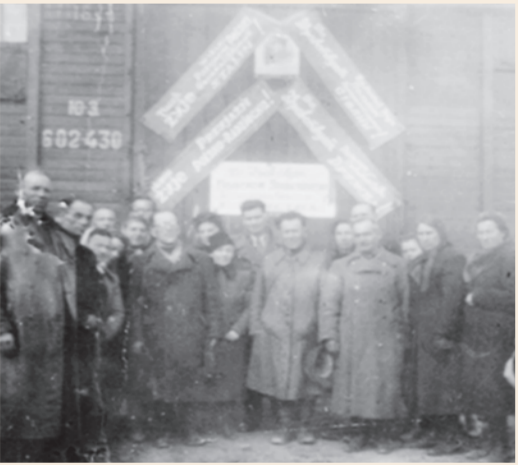
КСРО мен Польша республикасы арасындағы келісім негізінде поляк азаматтарын реэвакуациялау, 1946 жыл