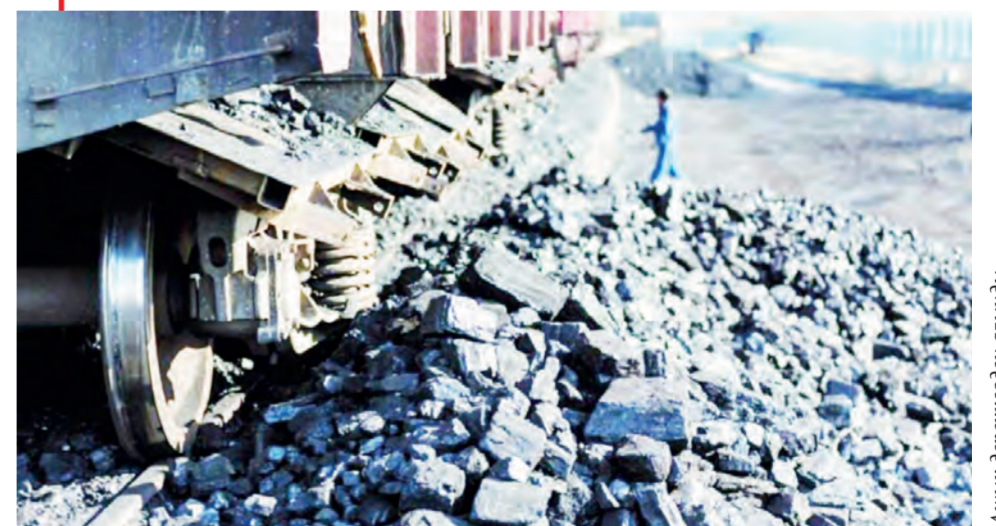
Ашық депрессиядан алындай