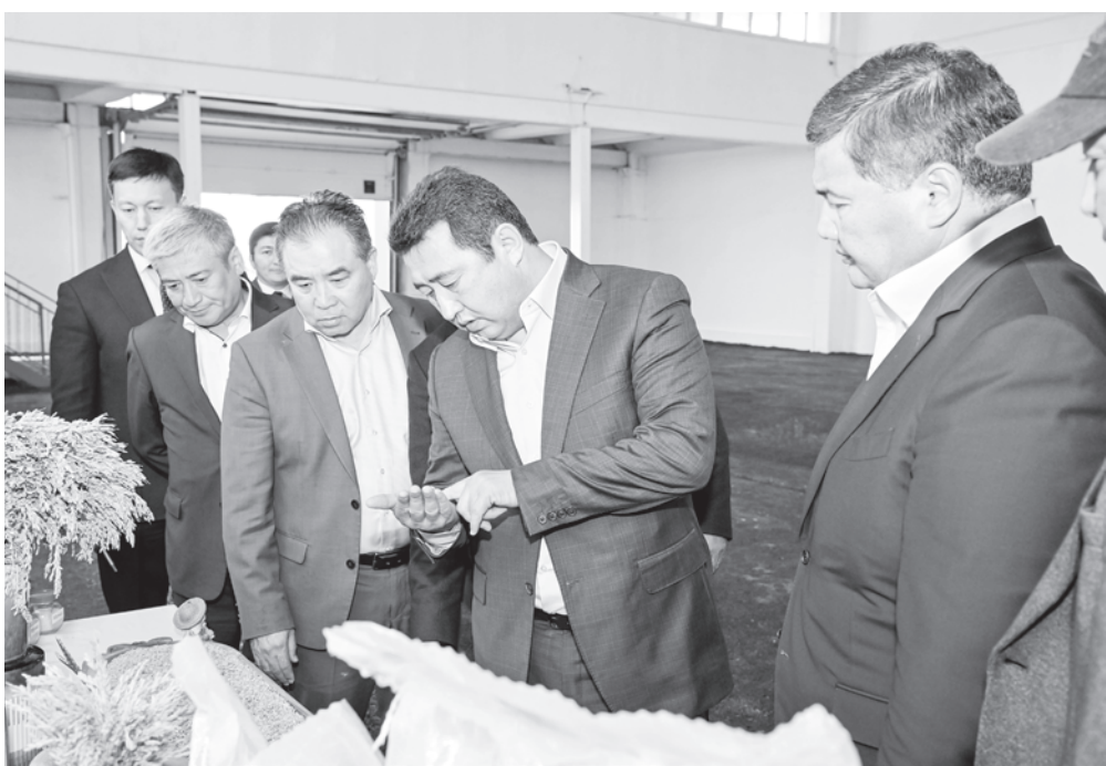
Облысқа жұмыс сапарында ҚР Ауыл шаруашылығы министрі Айдарбек Сапаров Жалағаш ауданындағы «Таң ЛТД» ЖШС-ның күріш ақтау зауыты және ет өңдеу цехының жұмысымен де танысты.

Таң ауылдық округіндегі «АгроЛидер Таң» ЖШС-ның ет өңдеу цехы 2019 жылы іске қосылған. Жоба құны 111 млн теңге, оның 53 млн теңгесі «Байқоңыр» ӘКК тарапынан, 58 млн теңге – серіктестіктің өз қаражаты.