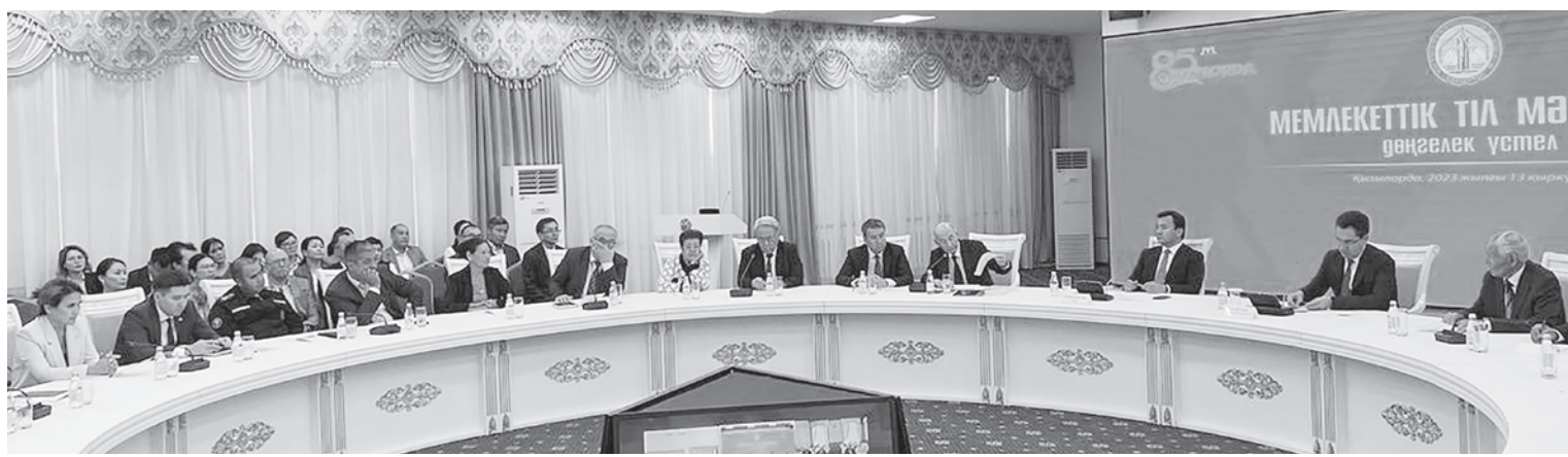
Кеше облыс әкімдігінде Халықаралық «Қазақ тілі» қоғамының президенті Рауан Кенжеханұлының қатысуымен қазақ тілі мәселесі және оның келешегі туралы ой-толғамдарды ортаға салған дөңгелек үстел отырысы өтті.