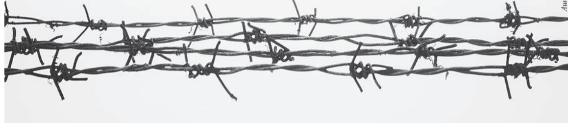
Алматы облыстық полициясы

патша үкіметі мен румын әскерінің офицерлері, ірі сауда, кәсіп иелері мен олардың отбасыларын жер аударуға Сталиннің рұқсатын алған. 1941 жылдың 12-нен 13 маусымына қараған түні Қазақстан (Ақтөбе, Оңтүстік Қазақстан, Қарағанды, Қостанай, Қызылорда), Коми, Краснояр аймағына, Омск, Новосибир облыстарына 30 мыңнан аса адамды мәжбүрлеп көшіруге жетекшілік етті. Одан кейін Хабаровск аймағы мен Қытай Шығыс бойынша НКВД басқармасының бастығы, КСРО Мемлекеттік Қауіпсіздік министрлігінің (МГБ) өкілі, КСРО МГБ теміржол және су көлігі басқармасының бастығы болып тағайындалды. 1953 жылы 3 шілдеде Берия тұтқындалған кезде Герман Демократиялық Республикасында іс-сапарда жүрген жерінен ұсталып, Мәскеуге жеткізілді.