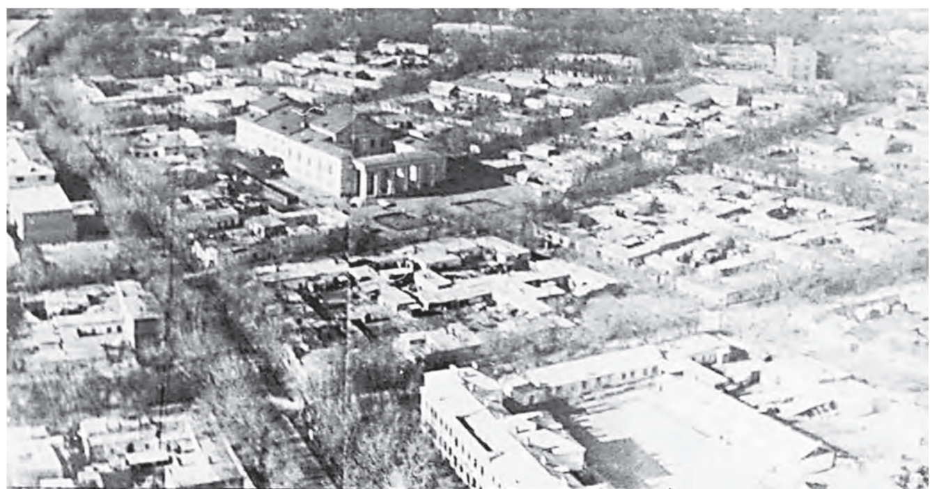
1970-жылдардағы Қызылорда қаласының ескі базар аймағының көрінісі

Мемлекет өз азаматтарының баспанамен қамтылуына мүдделі. Тұрғын үй құрылысы – тек мақсат ғана емес, ел экономикасының өрлеуіне серпін беретін зор күш. Тұрғын үй құрылысы бойынша облыс көлемінде жалпы алаңы 546 872 шар-