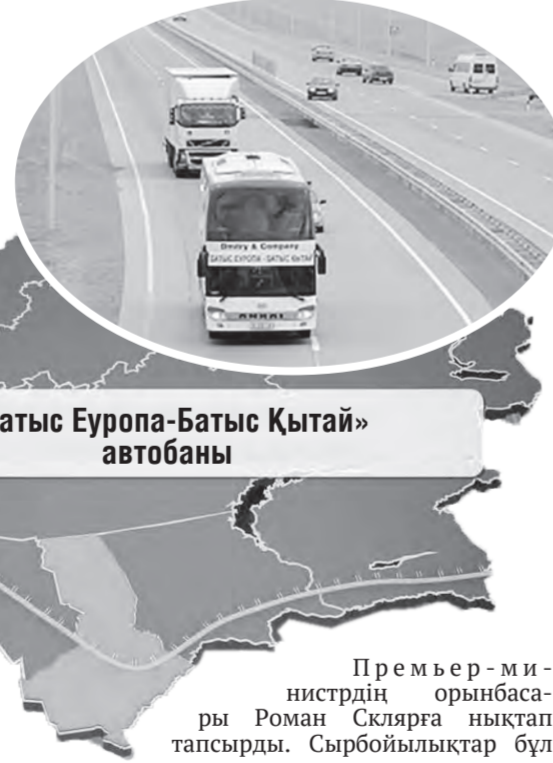
«Батыс Еуропа-Батыс Қытай» автобаны

Бір сөзбен айтқанда, жол инфрақұрылымы – өте маңызды әрі күрделі сала. Кез келген мемлекеттің даму деңгейі жол сапасымен бағаланады. Ал облыс бойынша биль жолға бөлінген қаржы мол. Қарымтасы қалай болары алдағы уақыт көрсетеді. Президент тапсырмасымен құрылған «Жол активтерінің ұлттық сапа орталығы» республика аумағында салынып жатқан немесе жөнделіп, жанартудан өткен автожолдардың сапасын сараптап-ақ берер. Аталған жолдардың әр қадамы адалдықпен төселсе, бұқара да базына айтпас дейміз.