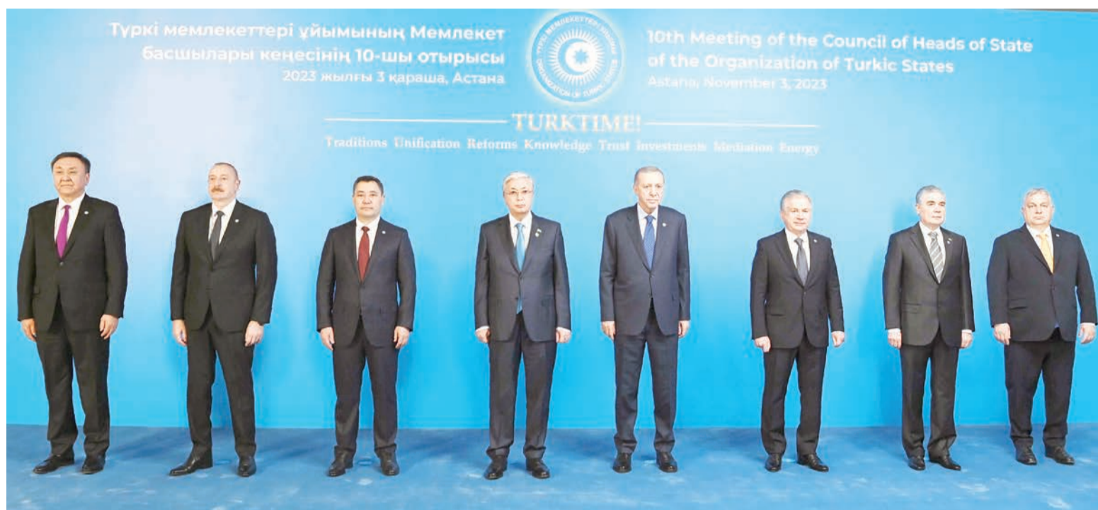
Түркі мемлекеттері ұйымының Мемлекет басшылары кеңесінің 10-шы отырысы 2023 жылғы 3 қараша, Астана