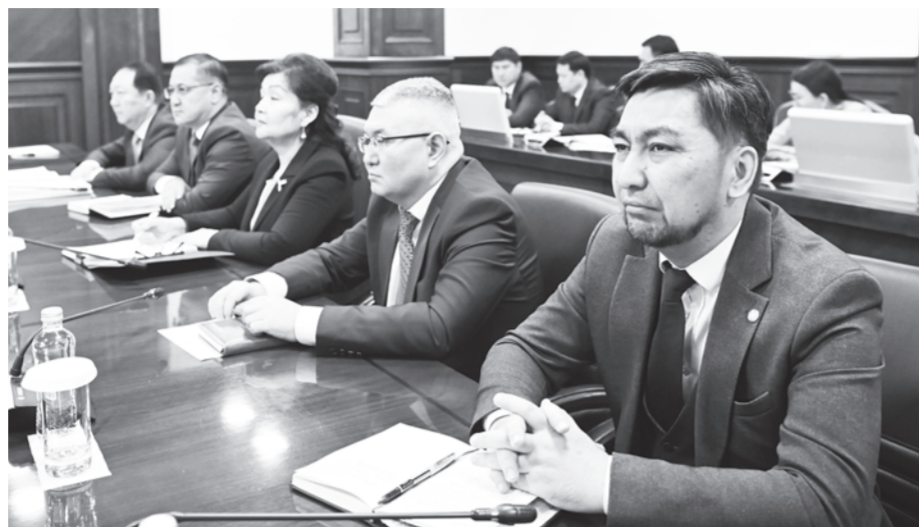
тандыру бағытындағы дақылдардың егіс көлемін ұлғайтуды қамтамасыз ету, шаруашылықтардың «Қазушар» мекемесінің облыстық филиалы алдындағы қарызын осы жылдың 1 желтоқсанына дейін толық есептесуін ұйымдастыру жөнінде тапсырма берілді.

Дегенмен, саладағы кейбір мәселелер әлі де өзекті күйінде. Мәселен, аймақтағы шаруа қожалықтарының «Қазушар» мекемесінің облыстық филиалы алдындағы қарызы 800 млн теңгеге жеткен, яғни төленуге тиісті қаржының 37 пайызы өтелмеген. Нұрлыбек Машбекұлы Қызылорда қаласы мен аудан әкімдеріне алдағы жылы егілетін күріш егіс көлемін 80 мың гектар деңгейінде тұрақтандыруды тапсырды. Оған қоса, су үнемдеу технологияларын пайдалану арқылы егіс көлемін ұлғайту үшін шаралар қабылдануы тиіс. Жауапты басшыларға әртараптандыру бағытында, су үнемдеу технологияларын қолдану арқылы егілетін егістің алдағы 3 жылдық орналастыру сызбасын бекітіп, облыстық ауыл шаруашылығы және жер қатынастары басқармасына жолдау міндеті жүктелді. Аталған басқармаға Қызылорда қаласы және аудан әкімдерімен бірлесіп әртарап-1-бет