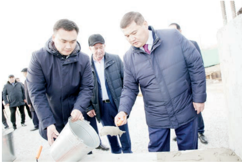
Суретерші: Айгүл Батталова