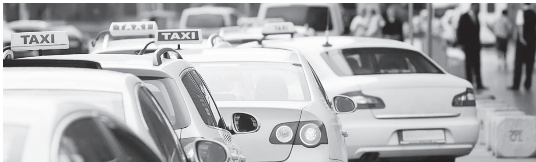
Анық серкемеден алтынды