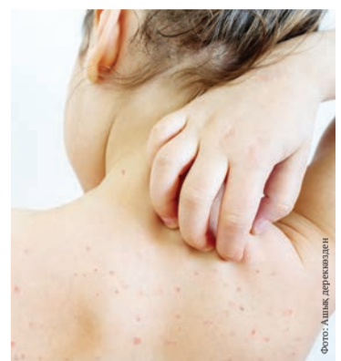
руға қарсы екпе алмағандығын көрсетті.