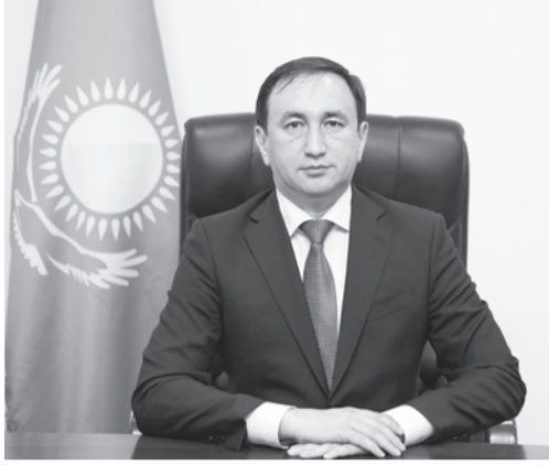
қаржы тартуда саладағы мол тәжірибесі мен кәсібилігін көрсетеді деп сенеміз, – деді аймақ басшысы.