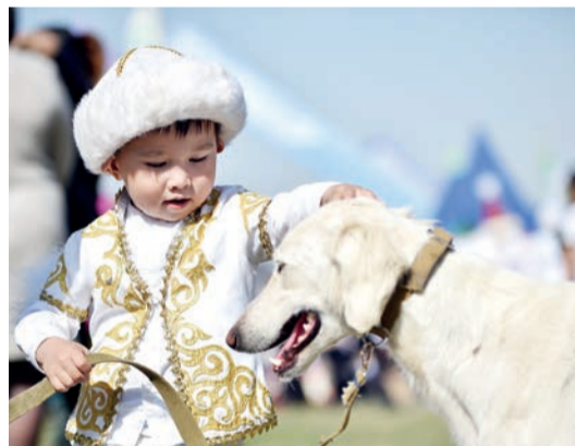
Ашық дереккөзден алынды