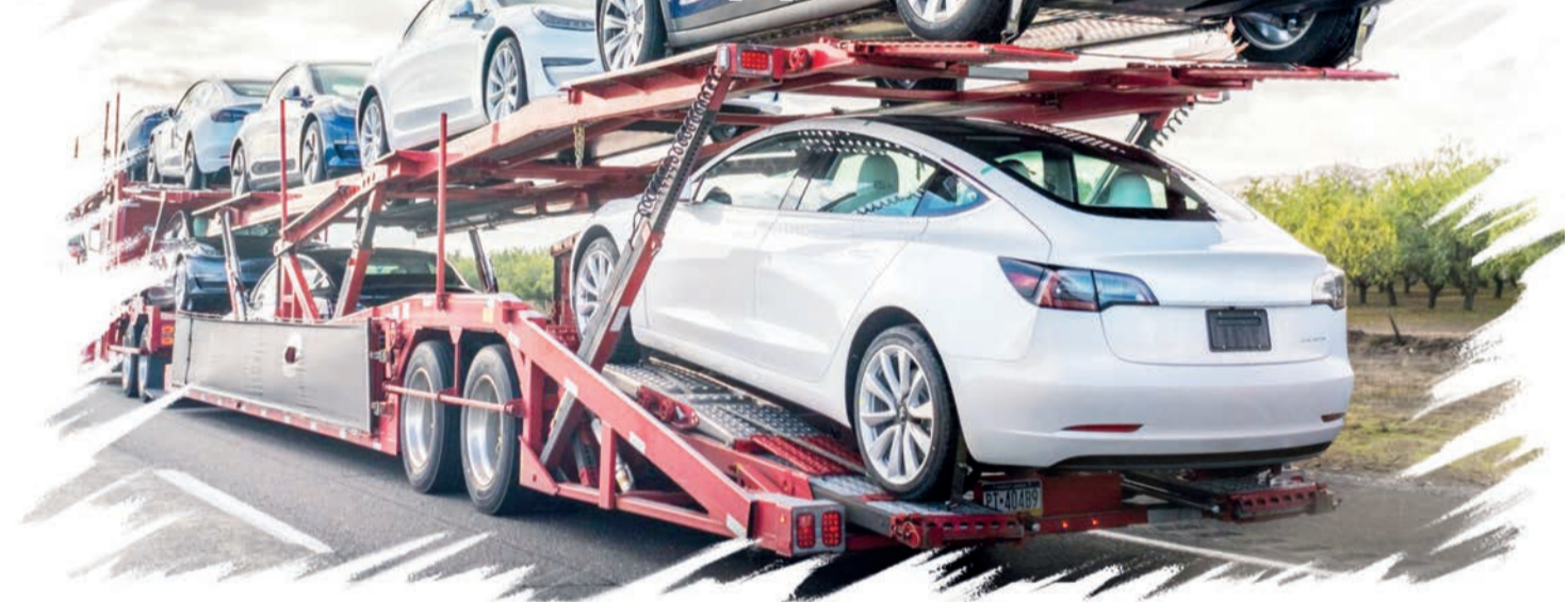
Ашық деректерден алынды

Талдауға қатысқан респонденттердің басым бөлігі алдағы жылы жеңіл автомобильдерді сатып алуға сұраныс 53,9 пайызға артады деп болжаған. Төрттен бірі жеңіл автомобильдерге деген сұраныс өзгеріссіз қалады десе, қатысушылардың 9,1 пайызы алдағы жылы сұраныс төмендеуі мүмкін деп санайды. Сарапшылар болжамына сай, Hyundai және Chevrolet брендтері нарықтағы көшбасшылық позицияларын сақтап қалмақ. Алайда Қытай автомобильдері 2023 жылға қарағанда тағы да арта түспек.