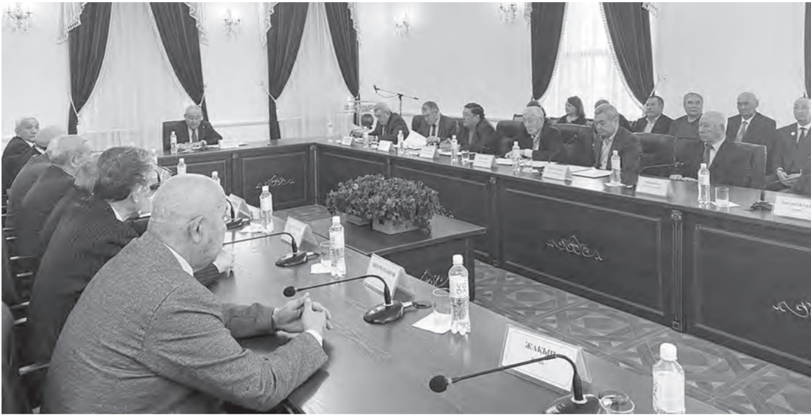
Бойынша жұмыстар жалғасын тапқан.