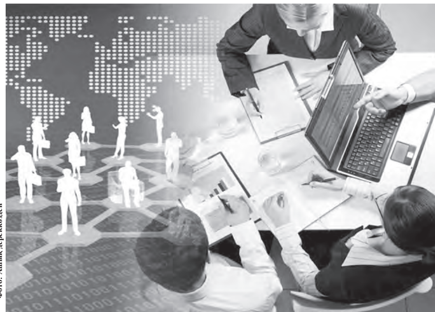
Фото: Аймак әрқарызы