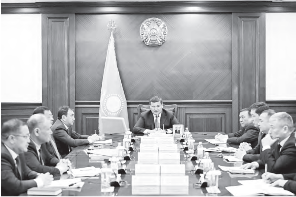
Комиссия жұмысына сын айтылды