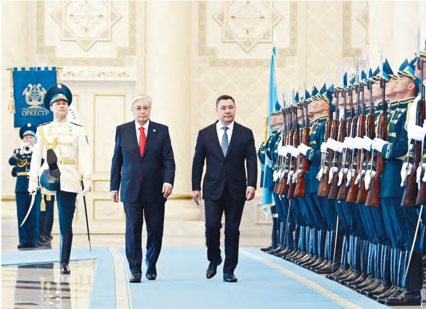
Мемлекет басшысы Қазақстанға ресми сапармен келген Қырғызстан Президентін Ақордада салтанатты түрде қарсы алды.

Келіссөз алдында Қасым-Жомарт Тоқаев пен Садыр Жапаров бір-біріне ресми делегация мүшелерін таныстырды. Құрмет карауылының бастығы мемлекеттер басшыларына рапорт беріп, екі елдің әнұрандары шырқалды. Содан кейін президенттер шағын құрамда келіссөз жүргізді. Мемлекет басшысы Қырғызстан Президенті сапарының екі тарап үшін де мән-маңызы айрықша екенін атап өтті. – Бүгін біз Одақтастық қатынастарды нығайту және кеңейту туралы тарихи келісімге қол қойдық. Осы маңызды құжат қазақ-қырғыз байланыстарының дамуына тың серпін бере-