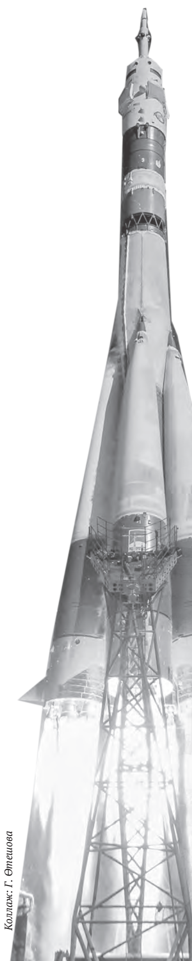
Коллаж: Г. Әлешова

Әлеуметтік инфрақұрылымды дамыту үшін қатынас қолайлы болуы шарт. Осы ұстаныммен алсақ, қадағалауы қатаң Байқоңырға кіріп-шығу тексерісі бір-