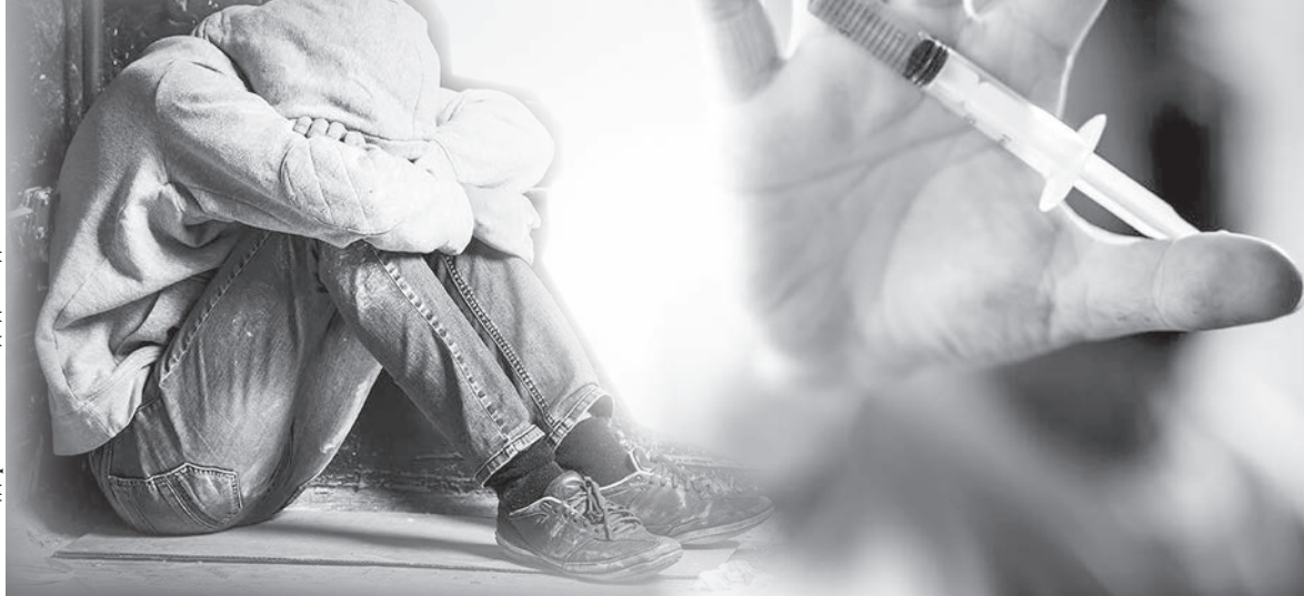
Аймақ дерекқоз негізінде дайындаған Г.Өтенова

Нашақорлық – әлеуметке ортақ проблема, қоғамның дерті. Есірткі – бұл адамның көңіл-күйін, сана-сезімін, мінез-құлқын бұзатын қауіпті, тыйым салынған химиялық зат. Ол адамның есін алып, құмарлық жиілігіне ұшыратады, есірткісіз өмір сүре алмайтын халге түсіреді. Қазіргі кезде есірткіге қарсы күрес жүргізу үшін дүние жүзі мемлекеттері аянып жатқан жоқ. Соның ішінде еліміз де есірткіге қарсы күресте мемлекеттік саясат жүргізіп, нашақорлыққа және есірткі бизнесіне қарсы күрестің бағдарламасын іске асыруда.