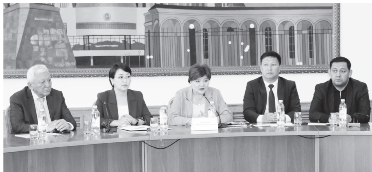
Қорқыт ата атындағы Қызылорда университетінің ұжымы да Президент Жолдауын талқылап, одан туындайтын міндеттер мен жоспарлар туралы ой бөлісті.

Мемлекет басшысы Қасым-Жомарт Тоқаев саяси маңызды құжатта ел дамуының негізгі сыртқы саяси, экономикалық және әлеуметтік векторларына тоқталды. Жылдағы дәстүрмен білім беру сапасын арттыруға да баса назар аударды. «Үкімет жоғары білім саласын халықаралық білім беру кеңістігімен ықпалдастырып жатыр. Қазірдің өзінде елімізде шетелдің белгілі 23 жоғары оқу орны жұмыс жүргізе бастады. Оларға мейлінше қолдау көрсету керек. Атап айтқанда, маман даярлауға берілген мемлекеттік тапсырысты біртіндеп көбейткен жөн. Бұл тәсілді білім бағдарламасы заман талабына сай келетін өз оқу орындарымызға да қолдануға болады» деді Президент.