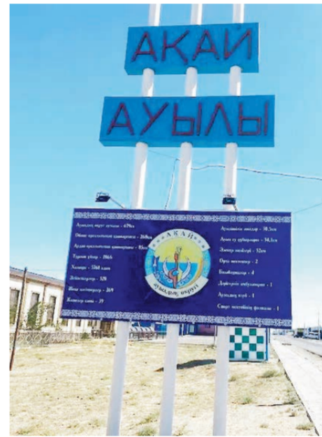
АУЫЛ ТАРИХЫ – ЕЛ ТАРИХЫ

«Ақай» ауылы алғашында 1957-1958 жылдары Кенес Одағы космонавтикасының орталығы Ленинск қаласын қажетті ауыл шаруашылығы өнімдерімен қамтамасыз ету мақсатында №22 әскери кеншар болып құрылған.