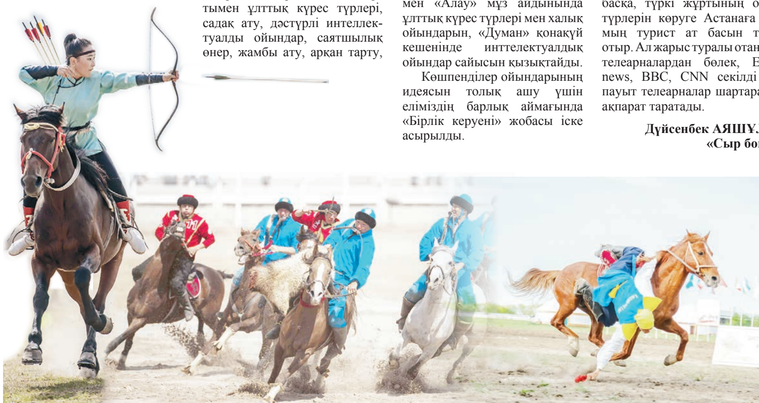
Қолжазба Қ. Орабаев