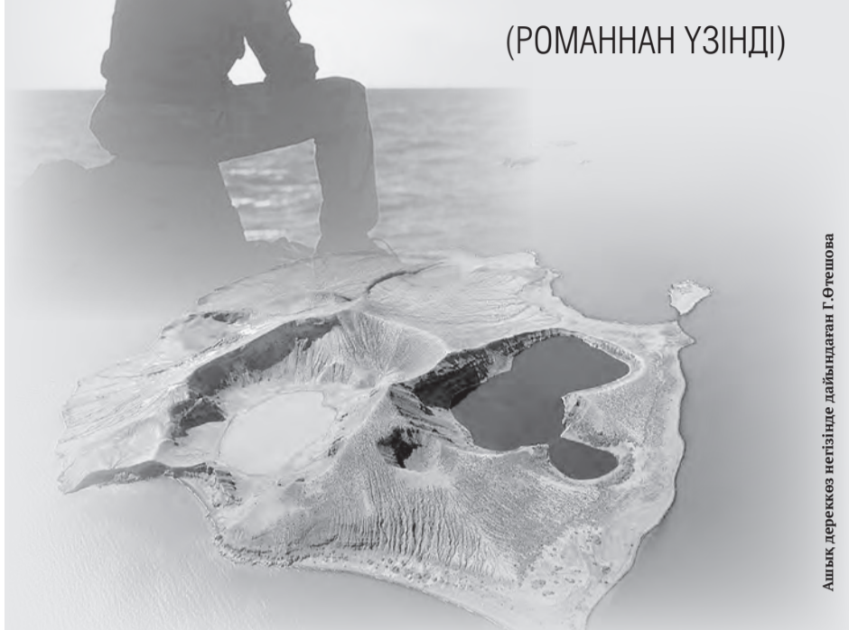
Алпақ дерексөз негізінде дайындалған Г.Өрешова

Әбден әлі құрып қапты. Сонда да белін бүкпей сексеуілдің қу бұтақтарын шыр-шырт сындырып, шелектің астына от тамызды. Сақал-мұрты қауғадай боп өскен, арып-ашыған бет-жүзін оттың ыстық лебі шарпыды. Рахат. Тұла-бойы жас баладай балбырап жүдә жеңілдеп қалды. Соның әсерімен орта шелек суға әлгі тырандарды тоғытып жіберді.