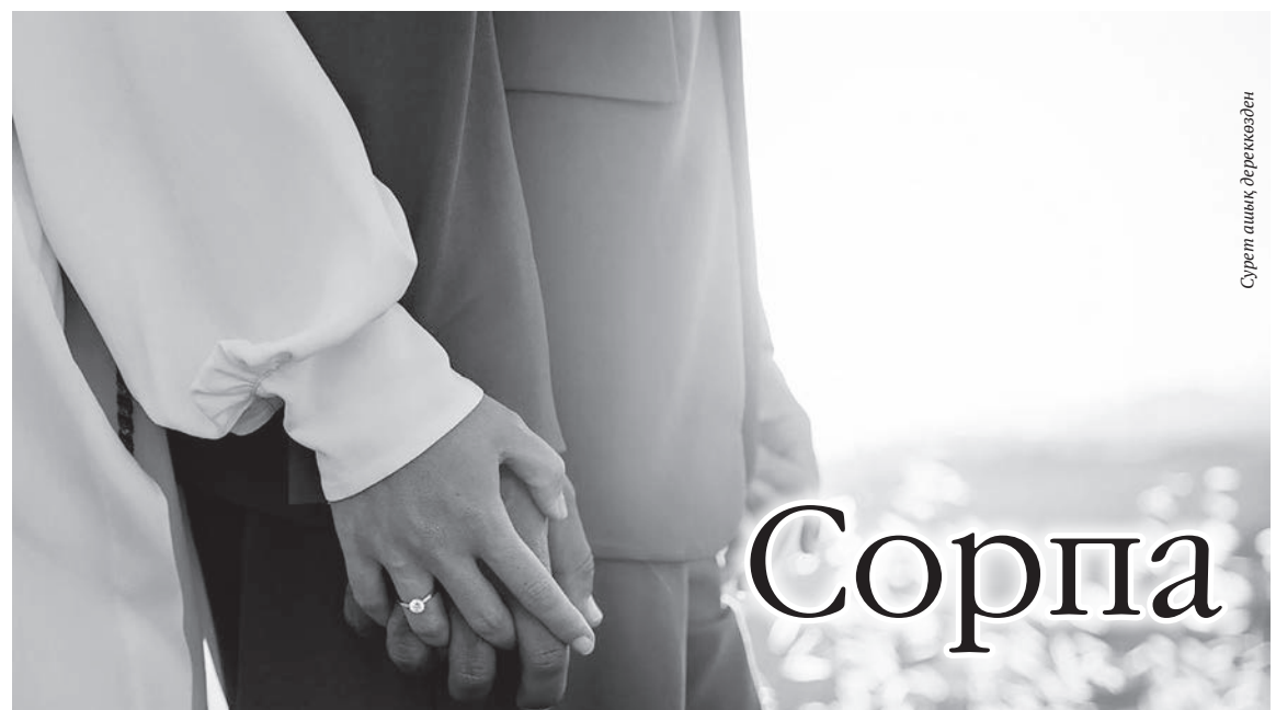
Сурет ашық дегенмен