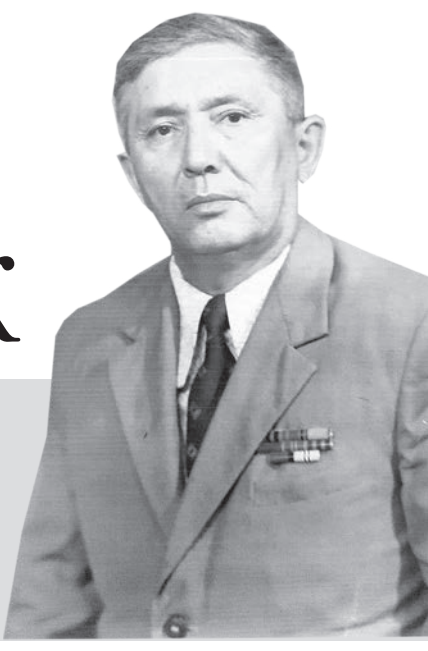
«Қайтпас батыр Сағындық, Қорған болып ел баққан. Қалмақтан алып теңдікті,

Шежіреге сүйеніп тарқатар болсақ, біз орта жүздің Найман руынамыз. Найманның Жұртшы аталығына жатамыз. Жұртшыдан екі бала Сағындық, Қалматай туады. Халық ақыны Болман Қожабайұлының «Сағындық батыр» жырында: