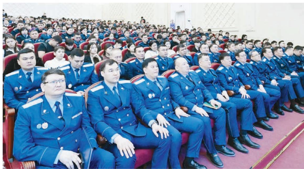
Суретші: Гүлсәуір Б. Есманов