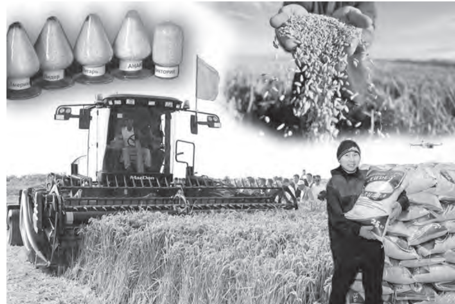
Ашық дереккөздер негізінде дайындаған Б.Салмурза.