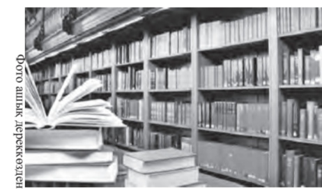
23 сәуір – елімізде ерекше мәнге ие күндердің бірі. Бұл енді тек Ұлттық кітап күні ғана емес, Кітапханашылар күні ретінде де аталып

өтеді, яғни кітап пен білімді дәріптейтін, рухани құндылықтарды насихаттайтын маңызды мереке.