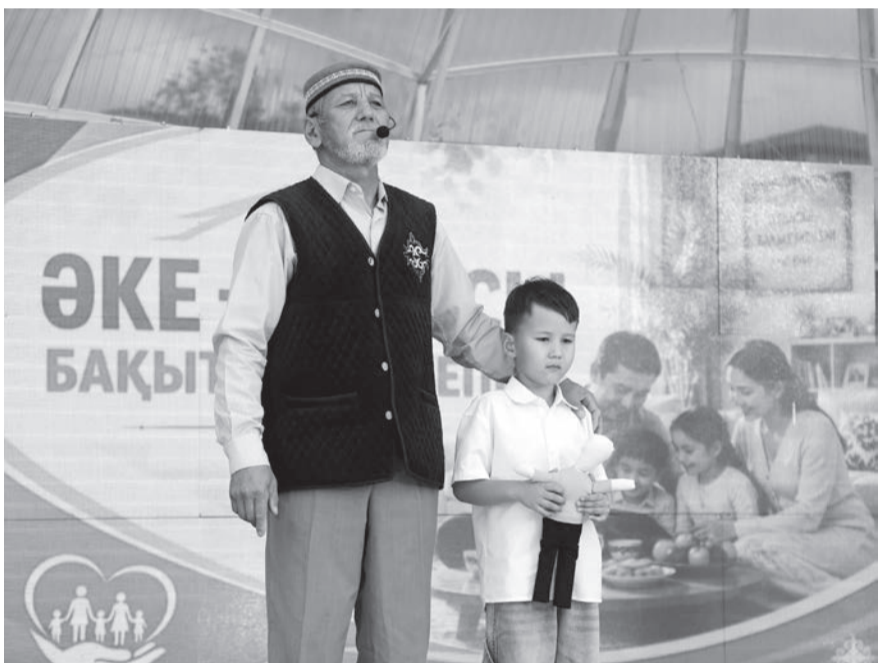
Аралдағы «Балықшылар аллеясында» «Әке – отбасы бақытының кілті» тақырыбымен тағылымды шара өтті.

Шаңырақтың берекесі, балаларын бақытына балаған асыл тұлғалардың орны қашанда айрықша екенін аңғартқан салтанатты кеште ұрпағына жол көрсеткен дана тұл-