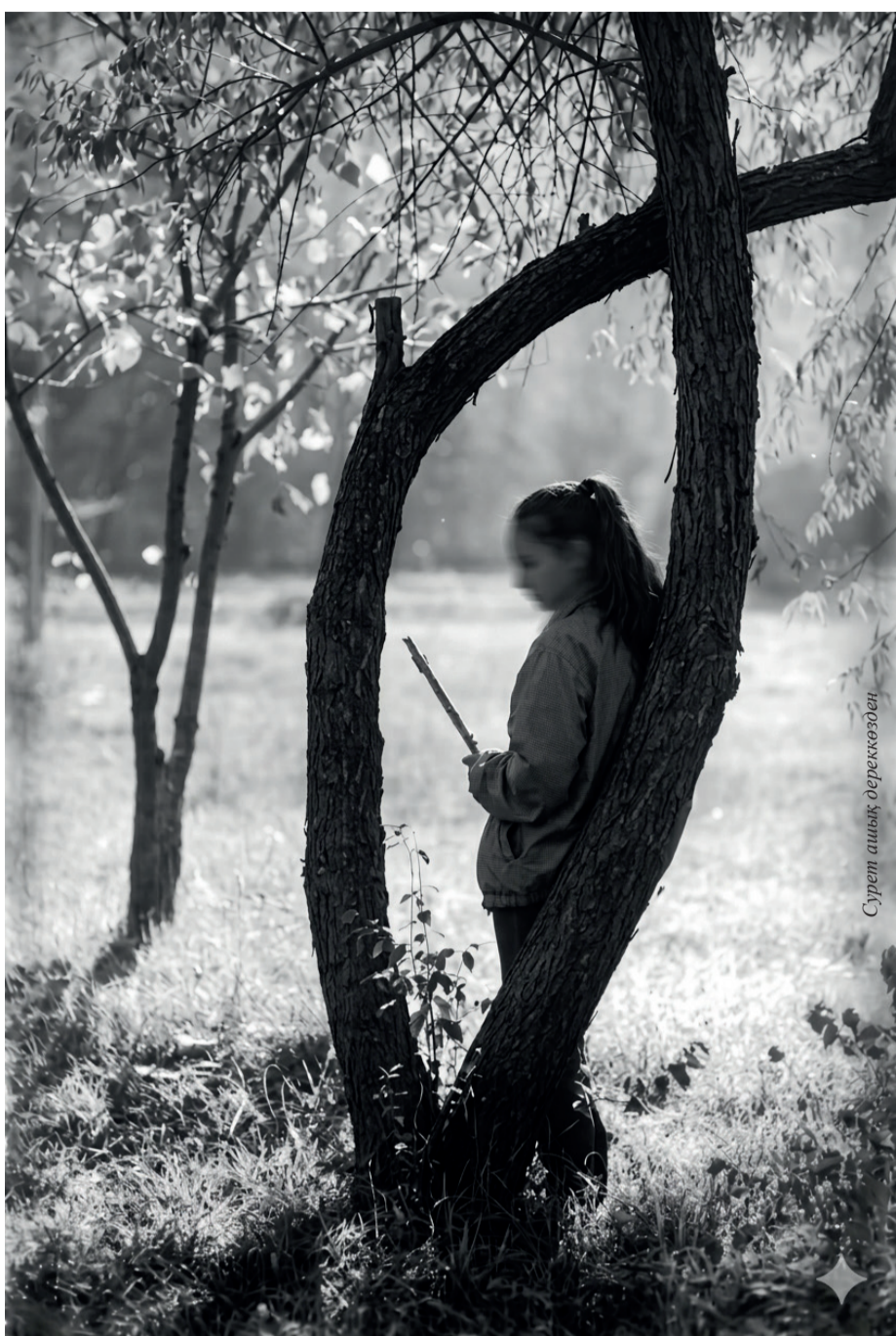
Сурет ашық оқиғалардан

– Бұған дейін қазақ қыздарымен бірге жүріп, дастарқанас болғаным жоқ. Ресейде сіздер сияқты қарақөз, әдемі қыздарды шам алып іздесең де таппайсың. Осында келгендегі бір мақсатым – көрікті қала Алматыны көру болса, екіншісі өздеріңіздей қыздармен танысу еді, – деп Дәуір күліп алды. Шамасы шындығы болар, мұндай азаматтар астарлап сөйлеуді біле