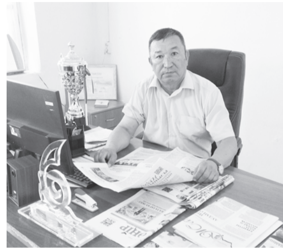
шебері, инженер-бақылаушы болып жұмыс істедім. Бірақ газет-журнал оқуды тоқтатпадым. 1999 жыл еді. «Кызылординские вести» газетін шолып отырсам «меншікті тілші керек» деген хабарландыруға көзім түсті. Басылымның Арал,

Аталған оқу орнының «Студент» газетінің редакторы қызметін атқарған бозбала әскерде жүргенінде де «Боевое знамя» газетінің тілшісі болған. «Екінші курстан соң 1984 жылы әскерге алындым. Эстонияның Хаапсалу қаласында борышымды өтедім. Сонда жүріп те жазудан көп үзбедім. Әскери округтің «Боевое знамя» газетінің тілшісі болдым. Ал оқу бітірген соң «Казсельхозтехника» мекемесінде мотор жөндеуші, цех