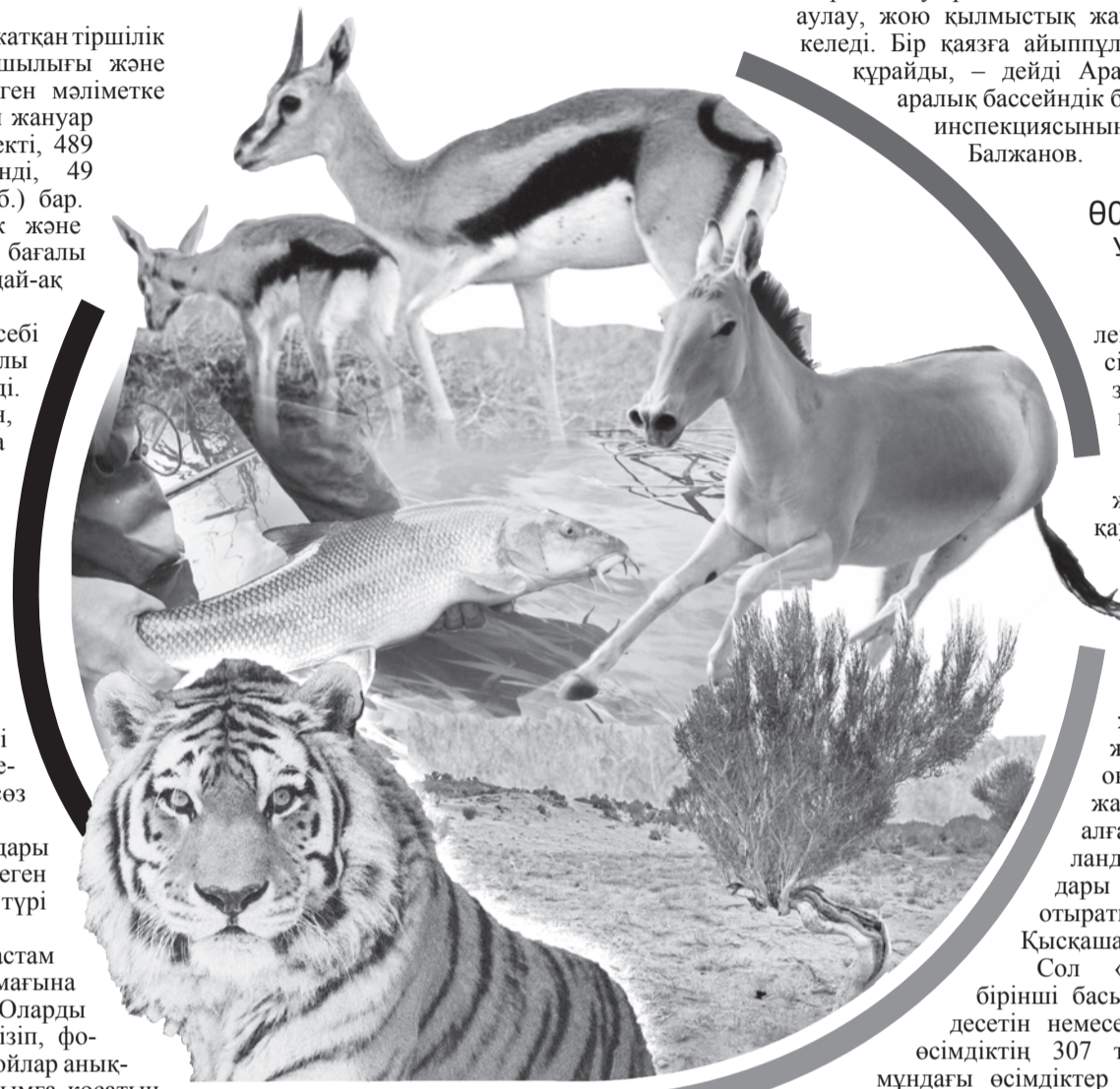
Коллаж Қуаныш Оразбаев