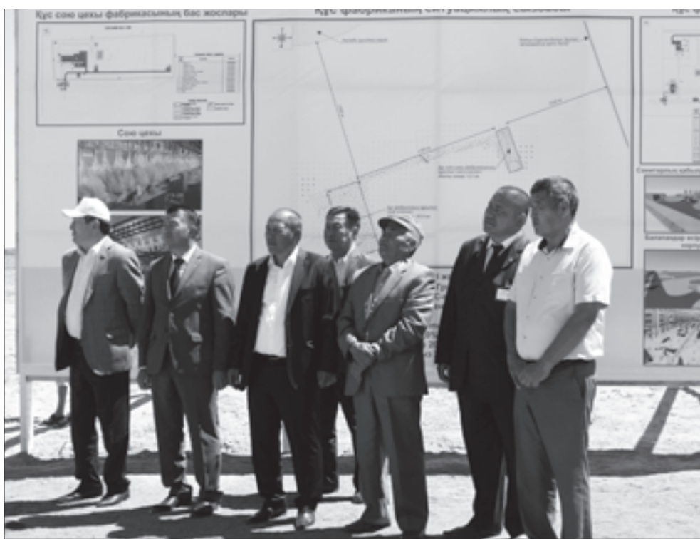
азығы қорын жасақтаудың маңызы зор. Бұл бағыттағы жұмыстар жүйесі қалай құрылған?

процентке ұлғайтып, 1700 гектарға егіміз. Бытыр біздің жерге ирандық сорт жерсінді. «Ақтобе» ЖШС бұл сортты 500 гектарға егуге дайындалып жатыр. Тағы бір үлкен жоба өнімді өңдеу саласымен байланысты.