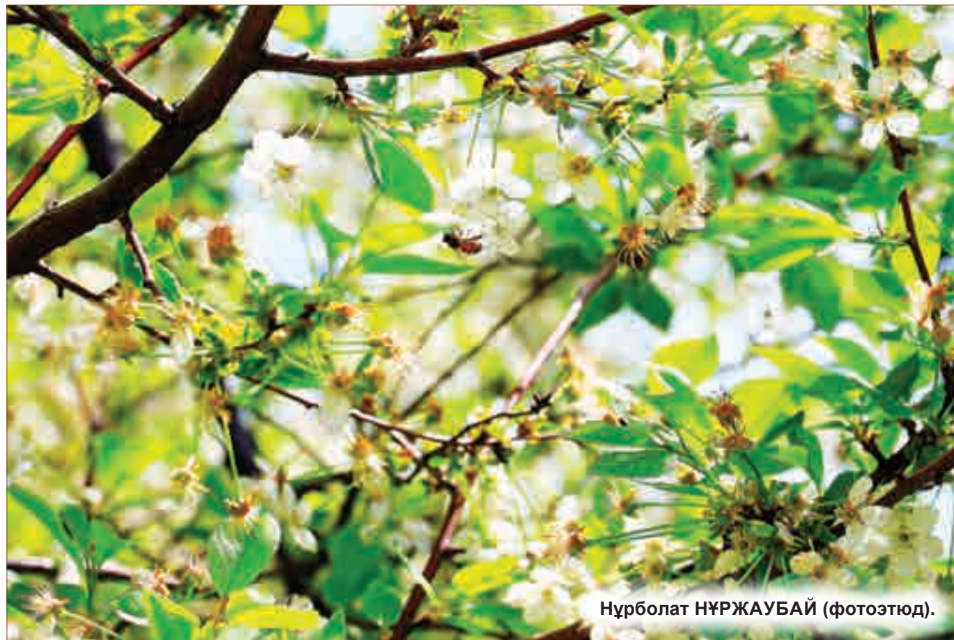
Нұрболат НҰРЖАУБАЙ (фототюд).