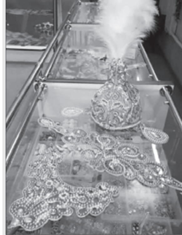
небір киім-бұйым тігіп, көптің алғысына бөленіп жүр.