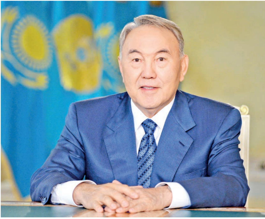
Қызылорда облысының әкімі Қ. Көшербаевқа

Құрметті Қырымбек Елеуұлы! Сізді және бүкіл Қызылорда облысының жұртшылығын Астананың 20 жылдығымен шын жүректен құттықтаймын!