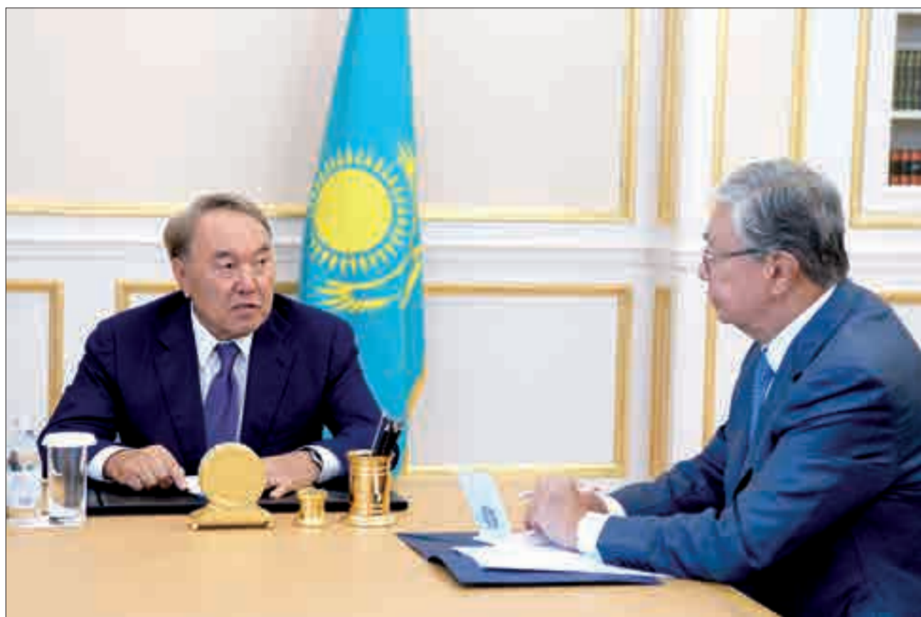
Кеше Елбасы Парламент Сенатының төрағасы Қасым-Жомарт Тоқаевты қабылдады, деп хабарлайды Ақорданың баспасөз қызметі

Кездесу барысында Мемлекет басшысына Парламенттің жоғары палатасының VI шақырылымы үшінші сессиясының негізгі қорытындылары мен алдағы сессияда қарастыратын заң жобалары жұмыстарының жоспары баяндалды. – Алдағы сессияда экономика саласына қатысты ауқымды заң жобаларын және бірқатар халықаралық құжаттарды қарастыру жоспарланған. Үкімет көптеген заңнамалық бастамалар әзірлеп жатыр. Бізге солармен жұмыс жасау