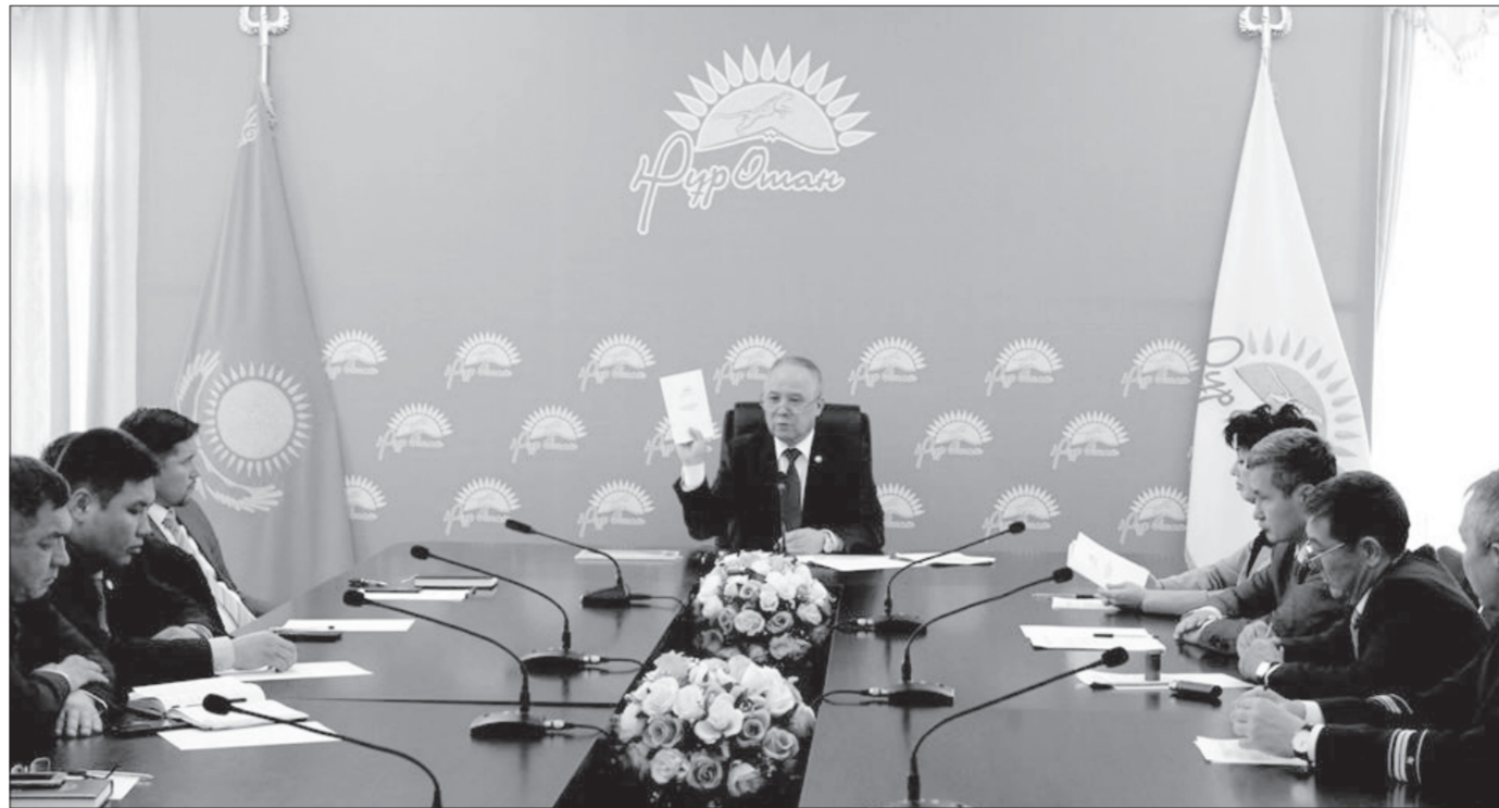
лына 8-16 жас аралығындағы 150 мың баланы тегін оқытуды көздеген «Балаларға арналған тегін IT сыныптар», балалардың дұрыс

Бүгінде партиялық жаңғырудың нақты жоспары бойынша көптеген жұмыстар қолға алынды. Оның ішінде еліміздің әлеуметтік, экономикалық, саяси және рухани жаңғыруына жан-жақты қолдау көрсетуге бағытталған 22-ден астам партиялық жоба жүзеге асуда. Олардың қатарында жы-