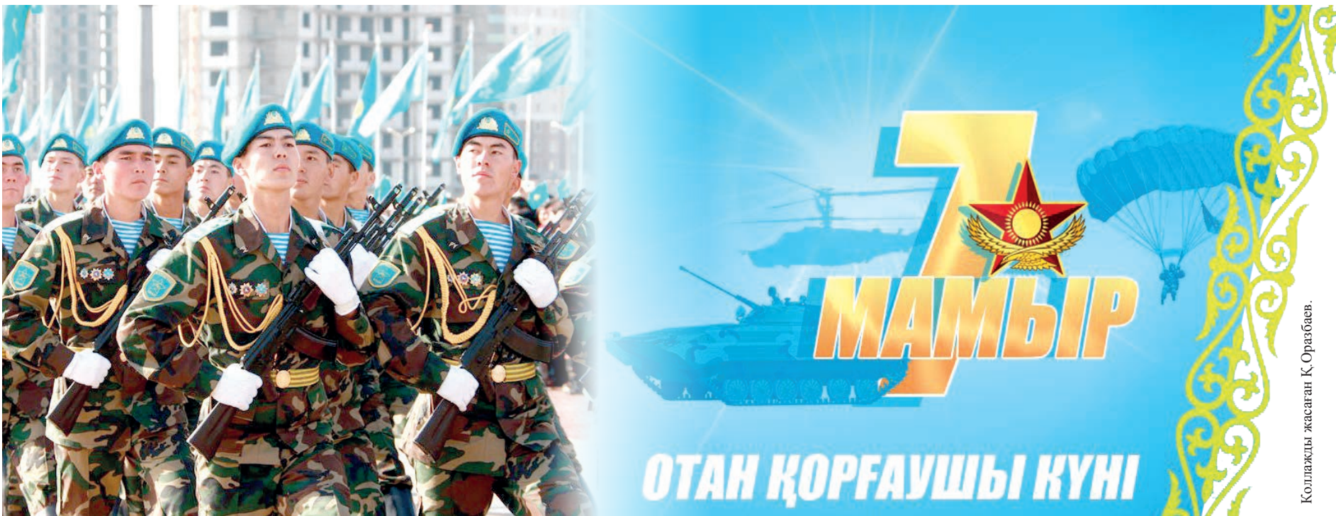
Коллаж жасаған Қ.Срәтбаев.

Осыдан 27 жыл бұрын, яғни 1992 жылы 7 мамырда ҚР Тұңғыш Президенті Нұрсұлтан Назарбаевтың «Қазақстан Республикасының Қарулы Күштерін құру туралы» Жарлығы шықты.