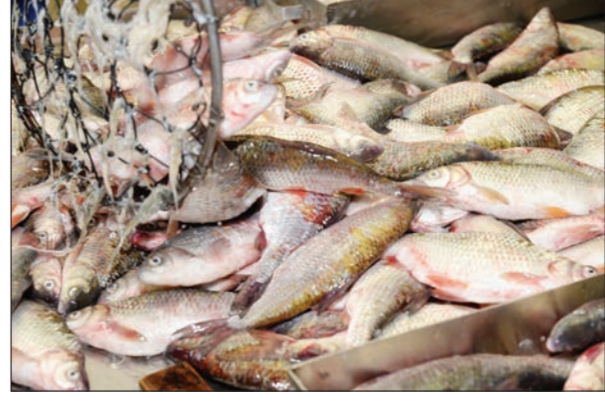
Өткен жылы экспортталған ауыл шаруашылығы өнімдерінің көлемі 34,5 млн долларды құрап, 2013 жыл-