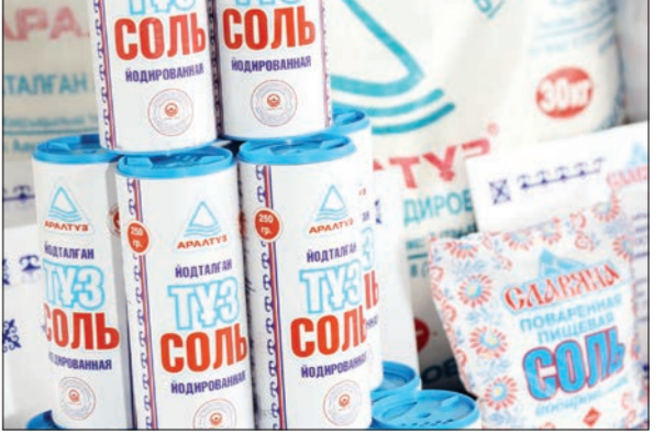
мен салыстырғанда 1,5 есеге өскен. Айта кетейік, өнімді өткізудің негізгі нарығы – Тәжікстан, Түркі-

менстан, Ресей, Украина, Монғолия, Польша және Нидерланды мемлекеттері.