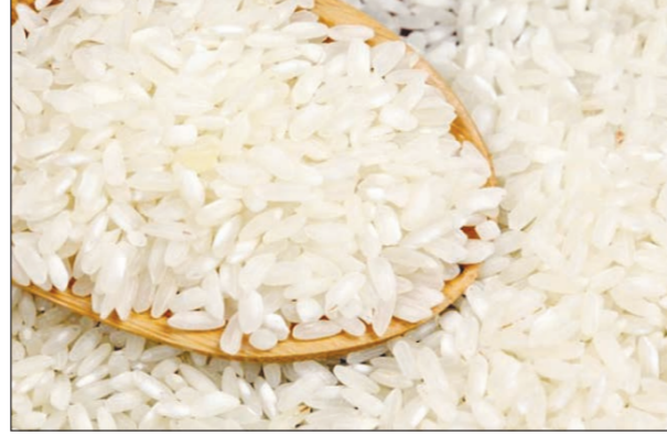
тын ауыл шаруашылығы өнімдерінің түрлері 5 есеге өсті (3-тен 16 түрге дейін).

Бұл ретте, ұсақталған күріш экспорты бойынша облыс әлемде 1 орын алып, жаһандық бәсекеестікте басымдыққа ие деп хабарлайды облыстық ауыл шаруашылығы басқармасы. «Жаһандық салыстырмалы артықшылыққа қол жеткізуде балық өнімдерінің экспортын қажетті деңгейге дейін ұлғайту зор мүмкіндік. Бұл индекс елдің тауар экспортының халықтың жан басына шаққандағы орташа әлемдік көрсеткішке арақатынасын өлшейді», – дейді басқарма басшысы Бақыт Жаханов. Жалпы, соңғы бес жылда облыстың агроөнеркәсіп кешенінде қарқынды даму байқалады. Мәселен, негізгі капиталға салынған инвестициялардың нақты көлем индексі 27 есеге артқан. Аймақ экспортының шоғырлану деңгейін талдау соңғы бес жылда экспорттың әртараптандырылуын көрсетеді. Осылайша, экспорттала-