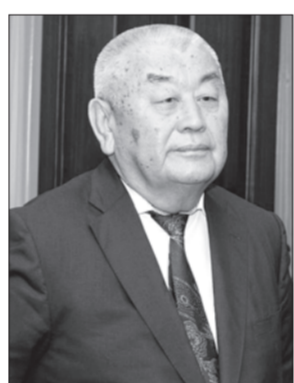
күш салды. Сайлаудың алдында мен ол кісінің «Россия» телеарнасына берген сұхбатын көріп, оның мемлекет саясатында орнықты тұлға ретінде іс-әрекет жасай-

Қасым-Жомарт Кемелұлы – еліміздің өркендеуіне үлкен үлес қосқан тұлғаның бірі. Ол жас мемлекеттегі дипломатия саласын көтеруге