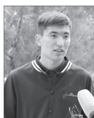
күн тәртібінен түспейтін болады. «Дипломмен – ауылға!», «Серпін» бағдарламалары аясында білікті жас мамандарды қолдау шараларын кү-

Сайлауалды бағдарламада көрсетілгендей, «Жастар – ел тірегі» атты арнайы әлеуметтік жоба іске қосылды. Мұнымен қоса 300 жас маман іріктеліп «Президенттің кадрлық резервіне» енеді. Жастарды жұмыспен, тұрғын үймен қамтамасыз ету, (NEET) санатындағы жастардың мәселелері