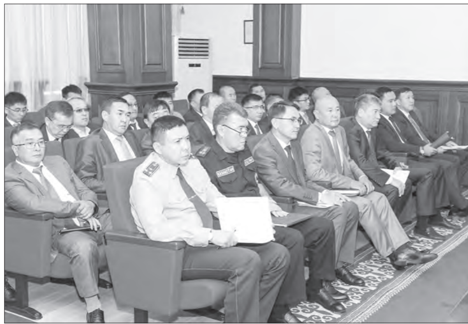
теңге болатын жобалар шығару және оларды мүмкіндігінше индустриялық аймақтарға орналастыруды ұйымдастыру ұсынылды.

«Қарапайым заттар экономикасы» бағдарламасы аясында жалпы құны 1145,5 млн теңгені құрайтын 9 жоба мақұлданды. Оның 1-і Қазалы ауданына, қалғаны Қызылорда қаласына тиесілі. Осы арада барлық әкімдікке әр бағдарлама бойынша жыл соңына дейін несие портфелі кемінде 1 млрд 1-бет.