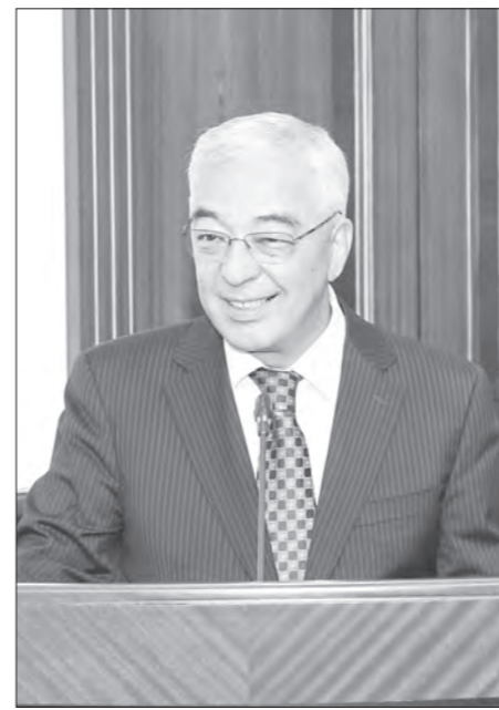
– Осыған дейін облыс орталығындағы Сырдария өзенінің сол жағалауында Жастарға қызмет көрсету орталығы салынып, Г.Мұратбаев атындағы орталық стадион қайта жаңғыртылды. Арал ауданының Шияжа ауылында 150 орындық ауылдық клуб салтанатты түрде пайдалануға берілді, – деді

бөлінді. Осыған дейін он есе пайда әкелуі тиіс индустриялық аймақтардың дені қазір бос тұр, – деді. Қызылорданың құрылыс алаңында жұмыс қызу. Биыл өңірде 24 әлеуметтік нысан салу жоспарланса, оның төрт жартысы басталды. Арал ауданының Шияжа ауылында 150 орындық ауылдық клуб салтанатты түрде пайдалануға берілді, – деді